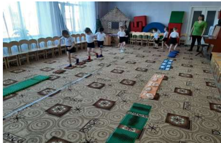
Ходьба по массажным коврикам и дорожкам