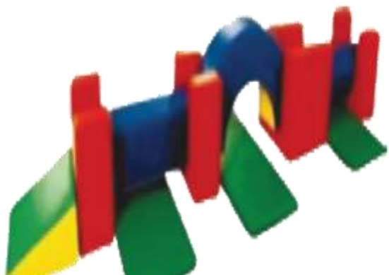
Мягкий модульный комплекс «Полоса препятствий»

Развивающая среда организованная в детском саду ,способствует эмоциональному благополучию ребенка , создает у него чувство уверенности в себе и защищенности