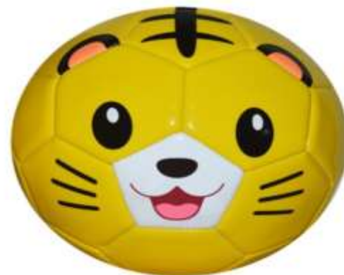
Мягкий мячик Сквиш