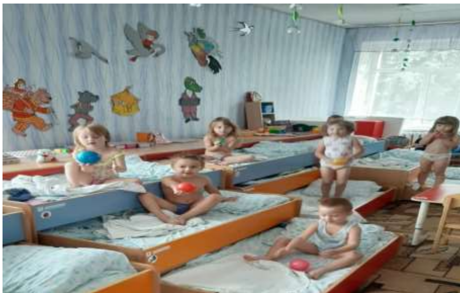
Гимнастика пробуждения с использованием массажных мячиков