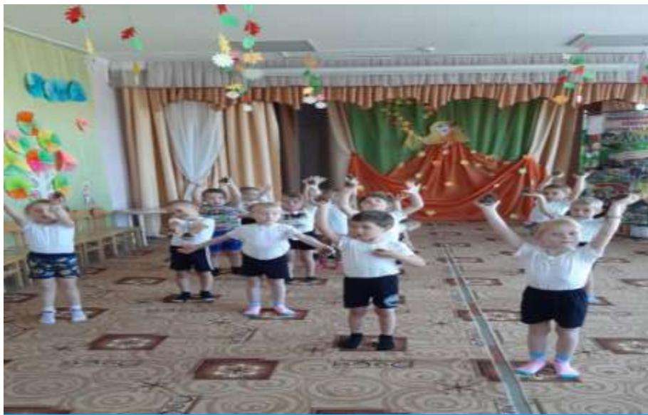
Самомассаж с еловыми шишками