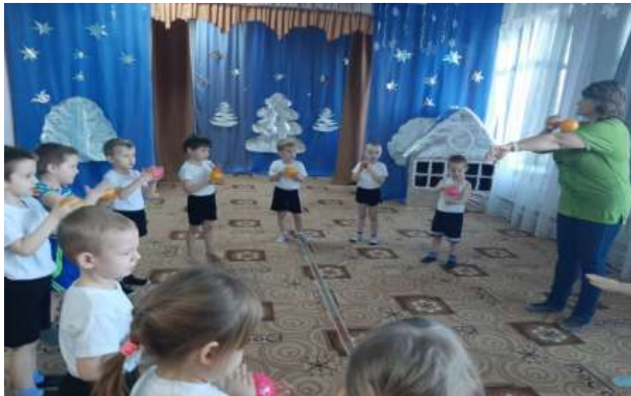
Су – Джок терапия